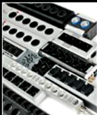
ОБЗОРНЫЙ ТЕСТ СЕТЕВЫЕ РАЗВЕТВИТЕЛИ ПО ЦЕНЕ ОТ 3200 ДО 65 000 РУБЛЕЙ